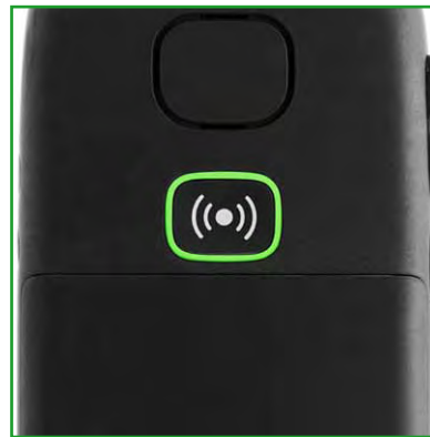
touche SOS au dos