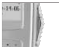
Interrupteur à 4 positions pour utilisation d'une seule main.