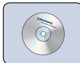
Logiciel DigtaSoft inclus