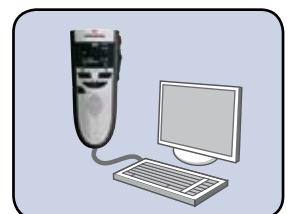
Connexion USB pour dicter Directement sur le PC