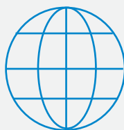
BASE DE DONNEES MULTI-PAYS*