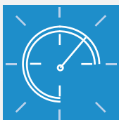
ALERTES SONORES ET VISUELLES DE SURVITESSE