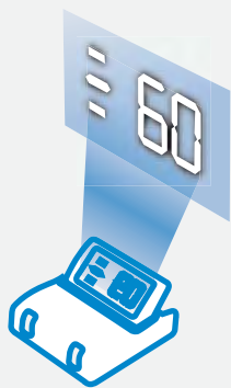
AFFICHAGE COULEUR TYPE TÊTE HAUTE

*Nécessite l'application d'un film réflecteur, fourni.