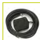
Antenne GPS externe