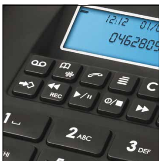
RÉPONDEUR FACILE À UTILISER