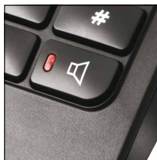
APPELER LES MAINS-LIBRES