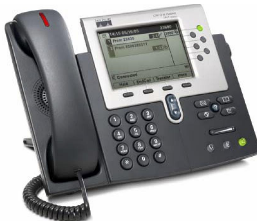
Figure 1. Le téléphone IP Cisco Unified 7961G-GE

Capable de fournir une bande passante illimitée à vos applications de bureau, le téléphone IP Cisco Unified 7961G-GE est équipé des plus récentes technologies et des derniers progrès en matière de téléphonie VoIP Gigabit Ethernet. Avec son port Gigabit Ethernet pour une intégration avec un PC ou un serveur de bureau (Figure 1), il permet à vos utilisateurs d'accéder rapidement aux données et aux applications du réseau. Disposant de fonctions identiques à celles du Cisco 7961G, ce téléphone IP Gigabit Ethernet amélioré pour cadres et dirigeants d'entreprise présente six boutons rétroéclairés programmables pour des lignes ou des fonctions et quatre touches interactives programmables qui guident l'utilisateur à travers les diverses caractéristiques et fonctions de l'appel. Il offre aussi des réglages audio pour les hauts parleurs duplex de haute qualité, le combiné et le casque. Son grand écran LCD de grande résolution à échelle de gris permet d'accéder facilement aux informations de communication, aux applications optimisées et aux diverses fonctionnalités de l'appareil (Figure 2). Il donne également aux utilisateurs et aux développeurs la possibilité d'installer à l'écran davantage d'applications innovantes et productives en langage XML (Extensible Markup Language) et peut afficher à l'écran des langues à « double octet ».