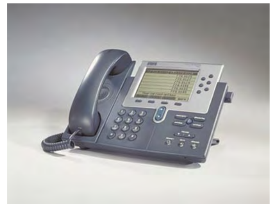
Figure 1 Téléphone IP Cisco 7960

fonctions d'appel. Il comporte également un grand écran à cristaux liquide. Cet écran permet l'affichage d'informations telles que l'heure et la date, le nom de l'appelant, son numéro de téléphone et les numéros composés. Ses possibilités graphiques permettent l'intégration de fonctions actuelles et futures.